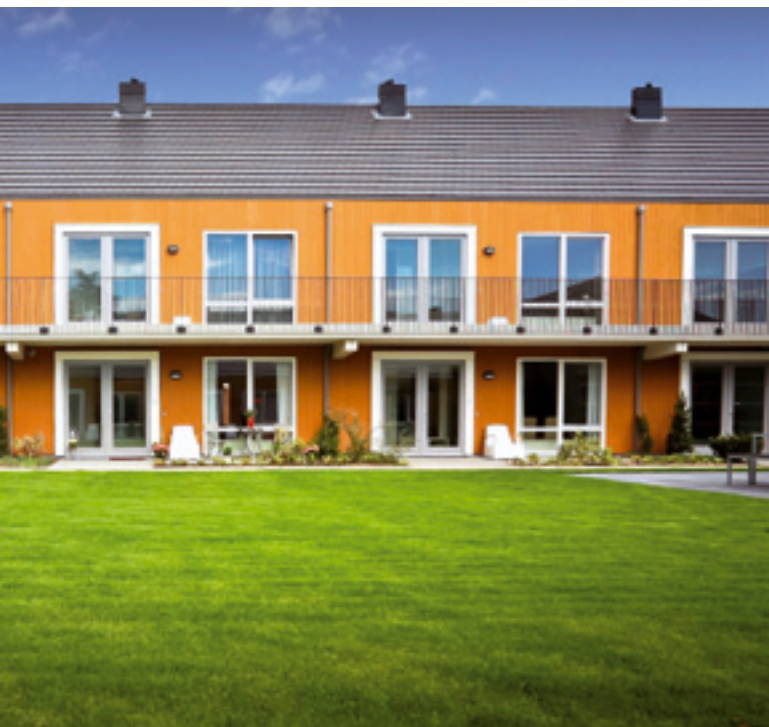
Stichting Plus Wonen in Leusden is speciaal gebouwd voor mensen met schizofrenie.