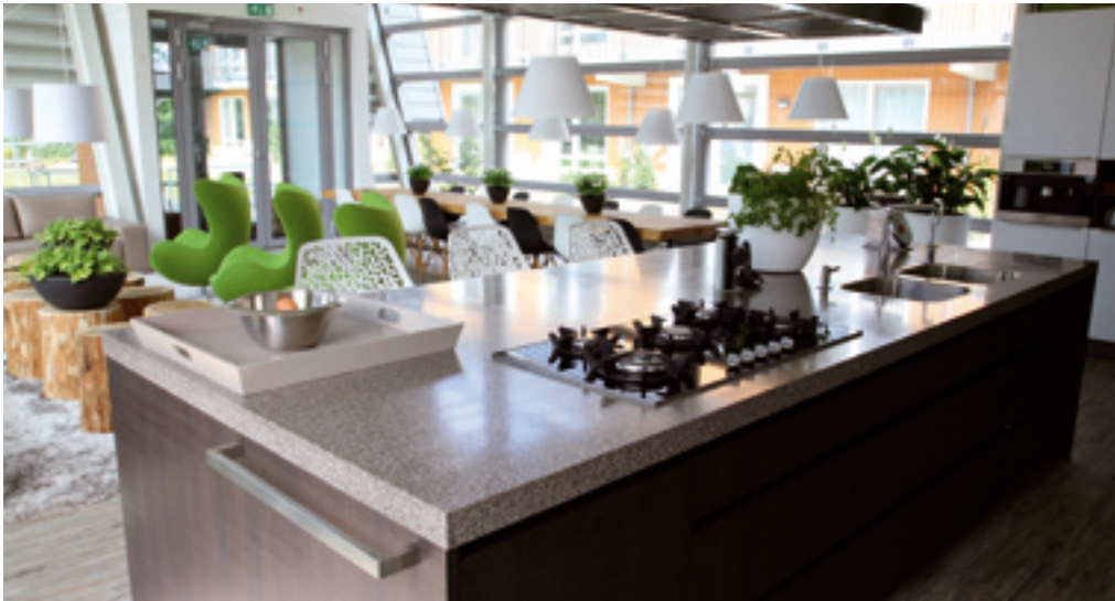
De keuken is de gemeenschappelijke ruimte.